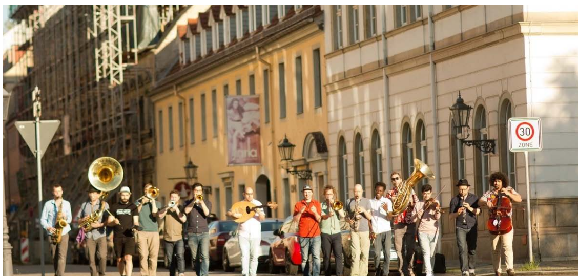
Banda Internationale / Andreas Hilger