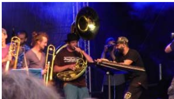
Concert at the TFF Rudolstadt

performances at twenty concerts, conducted seven interviews with different band members, and attended several band practices to gain a better understanding of their work and community. Focusing my