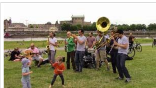
Concert at the Elbwiesen in Dresden

The rattle sets in The bass drum gets louder.