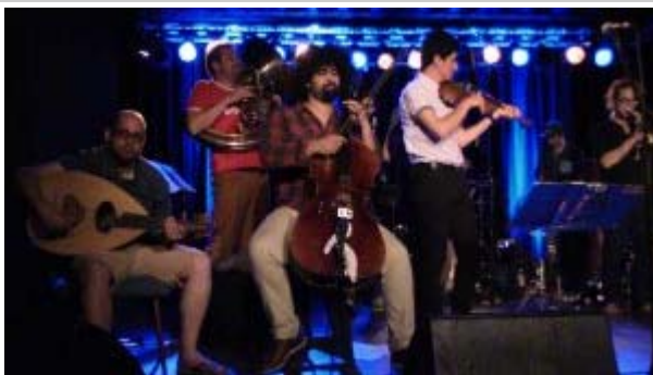
Concert at the Scheune in Dresden

right protest movement, emerged in Dresden, and caused a range of debates about the social inclusion of migrants. In response to nationalist claims, NO-PEGIDA counter-protest engaged in the cross-lingual and cross-cultural production of art to explore coping mechanisms for the impacts of global mobility. This summer I spent time in Dresden, exploring one of the most significant examples of this development, the musician collective "Banda Internationale" to understand the impacts of their efforts on community-building through the arts.