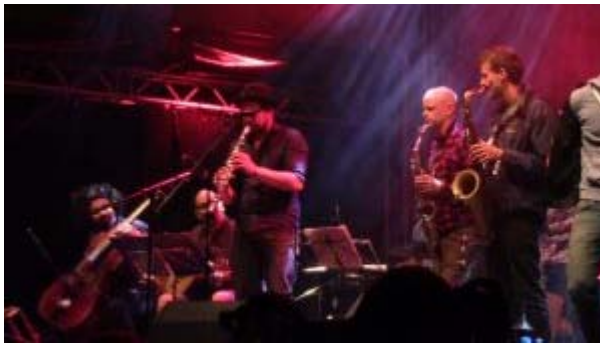
Concert at the Bergfunkfestival in Berlin.

and organized in German host communities, where national identities are highly contested. In 2014 PEGIDA (Patriotic Europeans Against the Islamization of the West), a nationalist, anti-Islam, far-